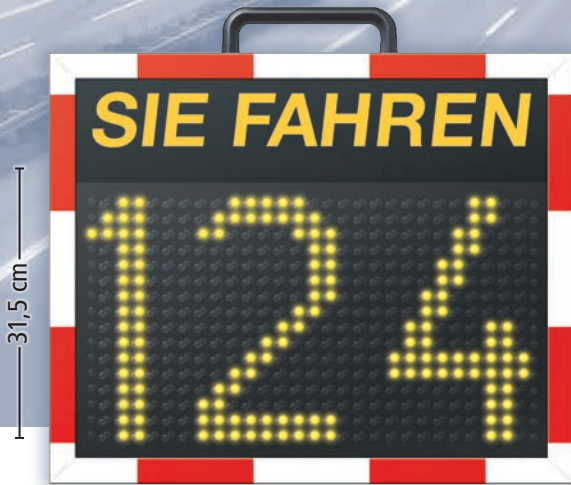
Abmessung: 63,4 x 54,4 x 18,2 cm (B x H x T)