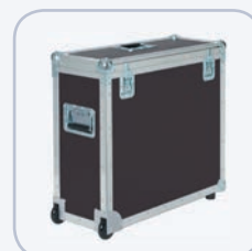
Transportkoffer (viasi PLUS und PLUS SMILE)