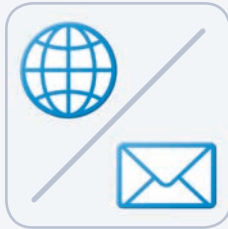
Modem für viacloud/ E-Mail Datentransfer