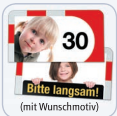
Klappblende (viasi MINI und viatext)