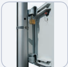
Ein-Mann-Montage-Set (Mast \varnothing 40 - 160mm)