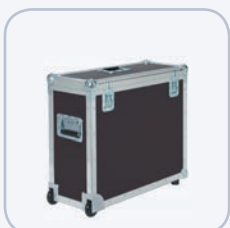
Transportkoffer (viasi BASIC und BASIC-D)