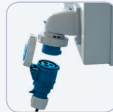
230V Versorgung (steckbar)